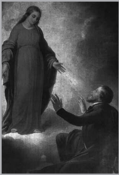
Aparición de la Virgen a Ratisbona. Basílica de San Andrea dell Fratre, Roma.

Enero de 2018. La apertura oficial del jubileo, con el cual se conmemorará el 175º aniversario de la aparición de la Milagrosa.