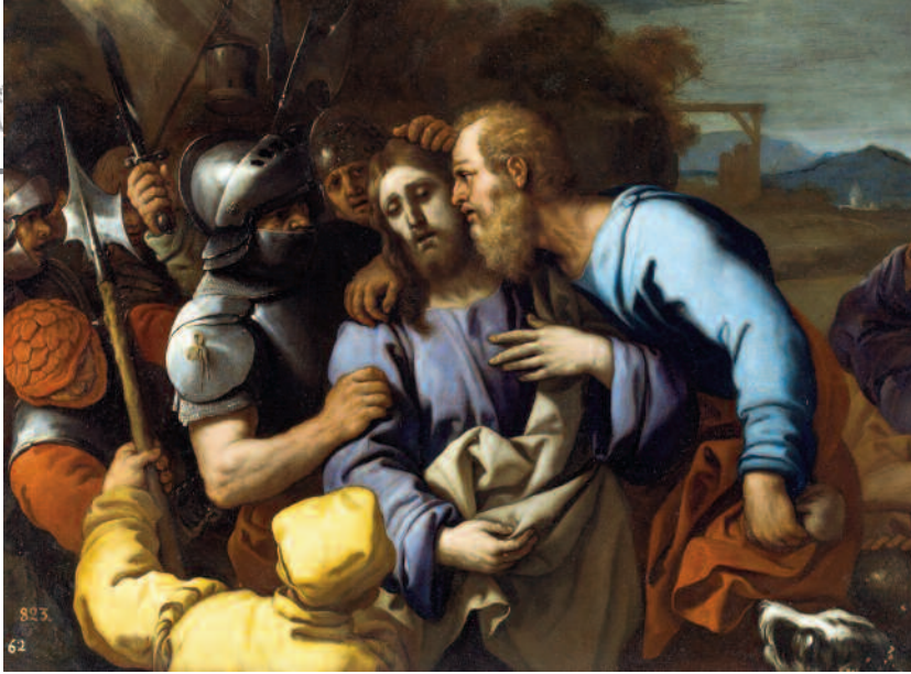
“El beso de Judas” Luca Giordano (1655-1660) Museo del Prado, Madrid