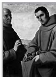
“San Diego de Alcalá”, Zurbarán, 1658-1660. Madrid, Museo Nacional del Prado

La infección de su cuerpo emitió una milagrosa fragancia y su cuerpo estuvo incorrupto. Reyes y príncipes acudieron ante sus restos. Felipe II llevó el cuerpo de San Diego al palacio para pedirle la curación de su hijo, el Príncipe Carlos. El milagro de su curación sería inmortalizado por Lope de Vega. Sus restos se encuentran en la Catedral de Alcalá de Henares y su cuerpo incorrupto se expone el 13 de Noviembre. ■