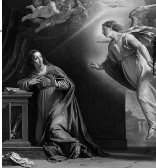
“La Anunciación”, 1644 Philippe de Champaigne. Metropolitan Museum of Art. Nueva York.

L A Maternidad divina de María fue proclamada dogmáticamente en Oriente, concretamente en el Concilio de Éfeso (431). Esta verdad de la fe católica sostiene que María es verdadera Madre de Dios, un título infante que le confiere una dignidad suprema entre las criaturas. Nuestra Señora dio a Cristo un cuerpo de carne: la Persona divina del Verbo asumió la naturaleza humana y, así, la naturaleza humana y la naturaleza divina quedaron unidas hipostáticamente en la Persona divina del Verbo. Por eso puede decirse con razón y verdad que María es Madre de Dios, frente a lo que el nestorianismo había especulado.