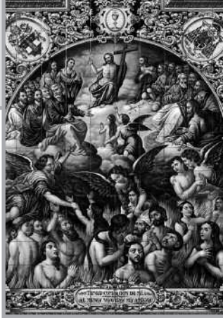
“Ánimas Benditas del Purgatorio”. Juan Oliver Miguez. Hermandad del Santísimo Sacramento y Ánimas Benditas del Purgatorio de la Parroquia del Señor San Pedro (Sevilla).