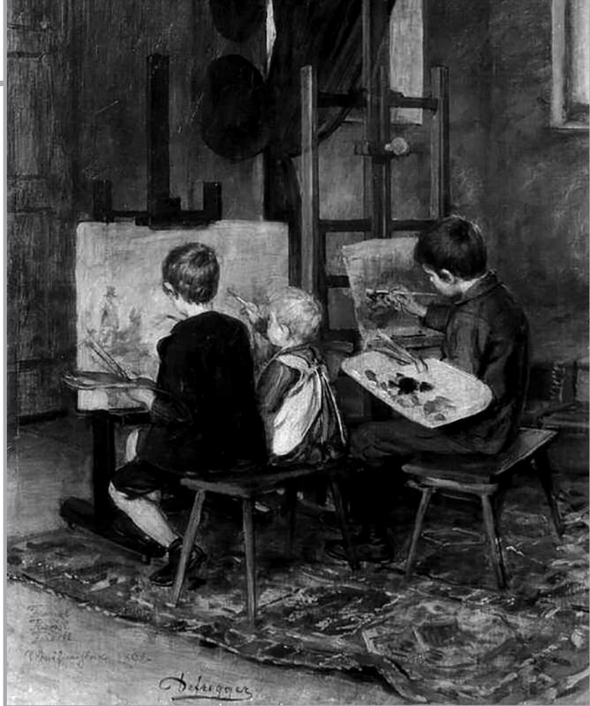
“Pequeños pintores”. Franz von Defregger, 1892. Colección privada.

proponiendo ejercicios de auto-control. Por ejemplo, evitar mirar escaparates, vencer la curiosidad de navegar por internet para estar a la última sensación, noticia o novedad del día o de la semana, etc.