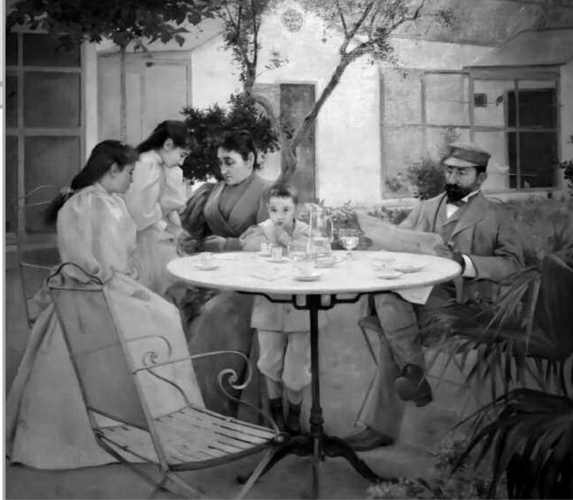
“Familia en el jardín” . Luis Graner Arrufi, 1895. Museo de Bellas Artes de Valencia.

tereses varios, el teléfono móvil y las redes sociales, pero necesitan encontrarse con personas y realizar grandes sueños, sin perder el tiempo en cosas que pasan y no dejan huella.