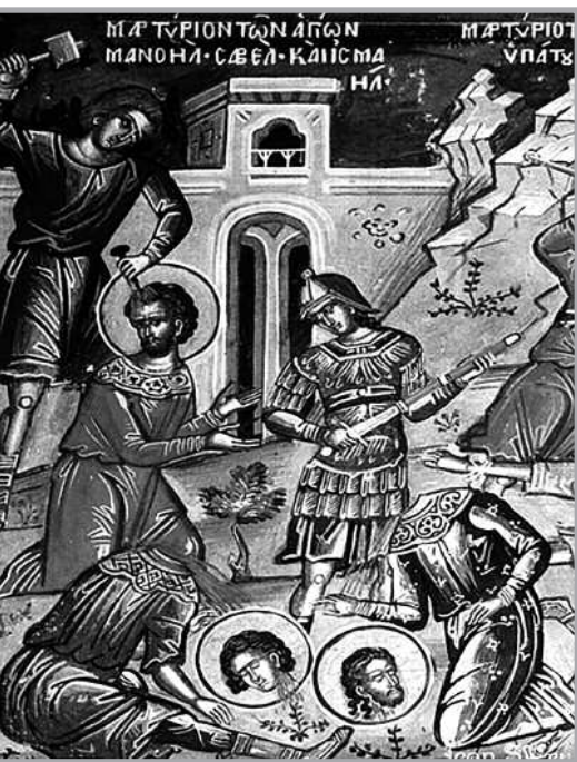
Martirio de Manuel, Sabel e Ismael.