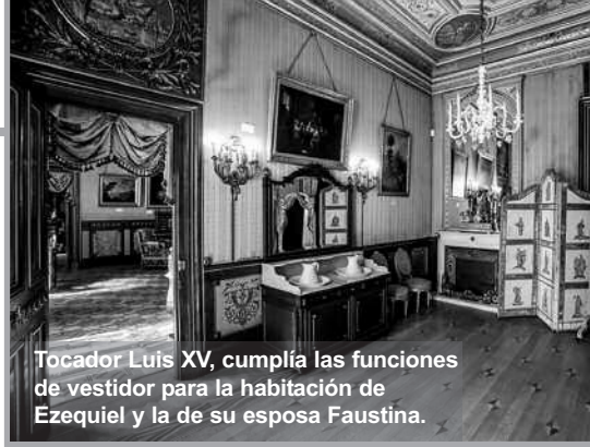
Tocador Luis XV, cumplía las funciones de vestidor para la habitación de Ezequiel y la de su esposa Faustina.