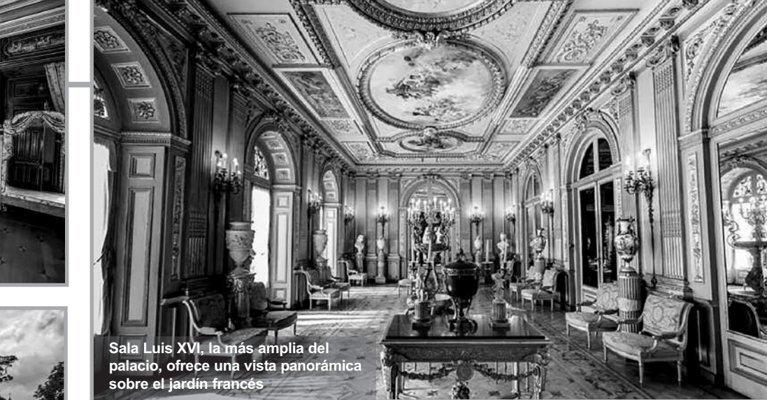
Sala Luis XVI, la más amplia del palacio, ofrece una vista panorámica sobre el jardín francés