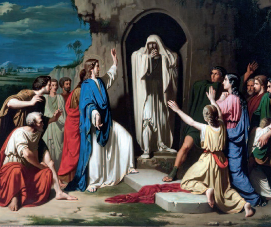
“Resurrección de Lázaro”, 1855. José Casado del Alisal. Real Academia de Bellas Artes de San Fernando, Madrid.