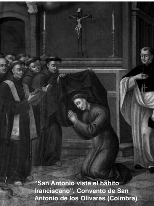
“San Antonio viste el hábito franciscano”. Convento de San Antonio de los Olivares (Coímbra)

C UANDO uno piensa en lo que fue la vida de San Antonio de Padua (de Lisboa, para Portugal y los países de influencia portuguesa), que no podemos menos que recordar que falleció a los 36 años y sólo tuvo una vida activa de apostolado de 10 años, se queda pasmado de lo que se puede realizar, cuando la persona está entregada en manos de Dios y dispuesta a seguirle, lógicamente en el estado de vida que le corresponda a cada uno.