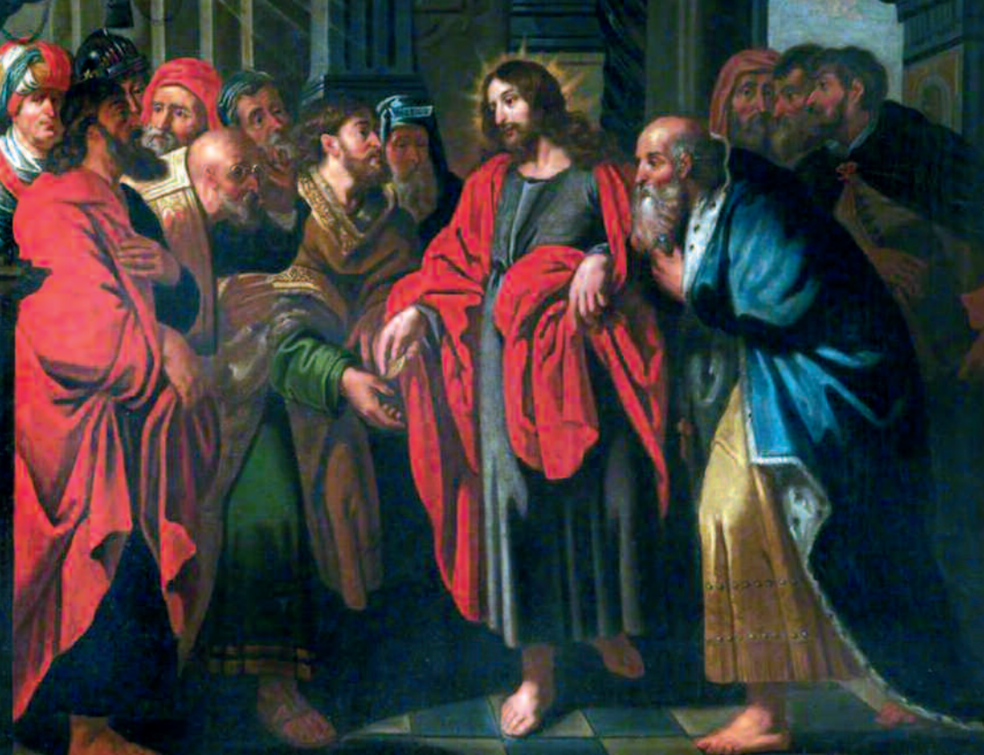
“El tributo”. Anónimo de la escuela flamenca próximo a Rubens. Museo de Bellas Artes de San Francisco (EE.UU.)