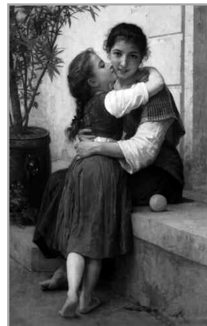
“Un poco de persuasión”. William-Adolphe Bouguereau, 1890.

Por favor, perdón, gracias: todo un programa de vida cristiana, buena convivencia, amistad, y amor