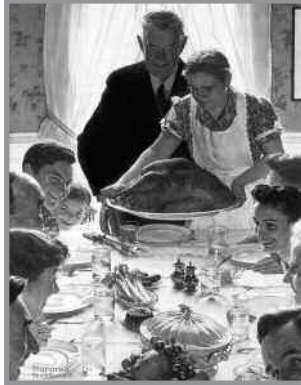
“Día de Acción de Gracias”. Norman Rockwell, 1943. Norman Rockwell Museum, Stockbridge, Massachusetts (Estados Unidos)

Es grande la preocupación de muchos padres y abuelos, por el alejamiento de la Iglesia que observan en sus hijos y nietos; a veces cuesta hasta animarles a acercarse a la Iglesia. La oración es un importante medio para pedir a Dios que les abra los ojos del alma y recuperen la vida religiosa, que tanto soporte les va a dar a lo largo de la vida. ■