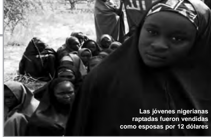
Las jóvenes nigerianas raptadas fueron vendidas como esposas por 12 dólares

Decía Valentín de Foronda, economista del siglo XVIII, que la