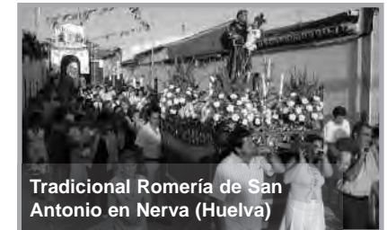
Tradicional Romería de San Antonio en Nerva (Huelva)