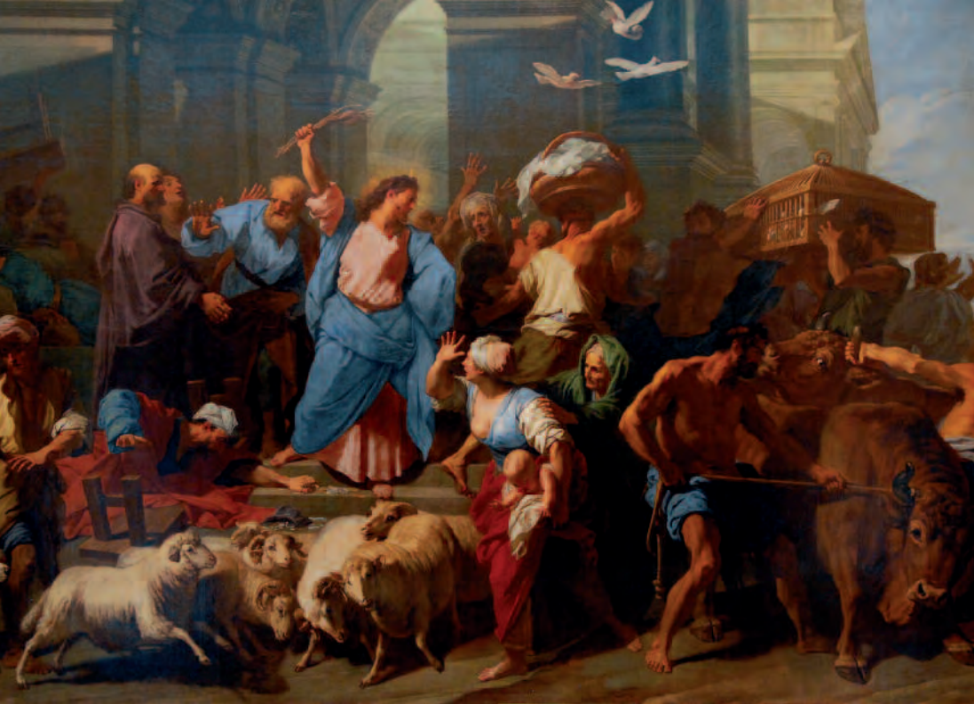
“Jesús expulsa a los mercaderes del Templo” Jean Jouvenet, 1706. Museo de Bellas Artes de Lyon (Francia).