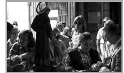
Distribución de Guindas y panecillos en San Antonio el Guindero (Madrid)