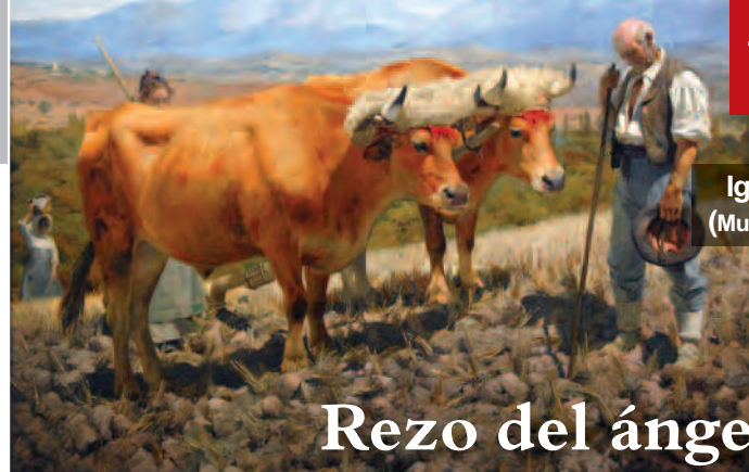
Ignacio Díaz Olano, 1899 (Museo de Bellas Artes de Álava)

¡Poner muy claro el nombre y apellidos del suscriptor! ¡Muchas gracias!