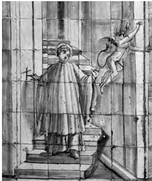
“San Antonio traza una cruz en la pared” Azulejo de la Iglesia de Santa Cruz en Coimbra (Portugal)

También nos cuentan sus biógrafos que Fernando abandonó a sus amistades de joven, me atrevería a decir de niño, porque comprobó que sus juegos le podían alejar de Dios. Hay que tener carácter y ponerlo en práctica para tomar una decisión así, sin complejos sobre el qué dirán otros de tu forma de actuar. El “qué dirán” siempre ha sido un “enemigo” de las personas pen-