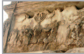
El saqueo de Jerusalén, del muro interior del Arco de Tito, Roma.

– ¡Ay del templo, ay de Jerusalén; voz de Oriente, voz de Occi-