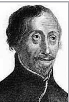
SAN ENRIQUE MORSE , PRESBITERO JESUITA, MÁRTIR

1 DE FEBRERO – Nació en Brome (Inglaterra) en 1595, de padres anglicanos. Estudió en el Bernard College de Londres, donde se convirtió. En 1614, comenzó los estudios para ser sacerdote católico.