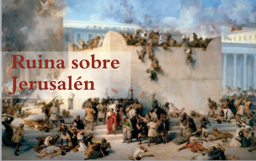
“Destrucción del Templo de Jerusalén”. Francesco Hayez, 1867. Galleria d'Arte Moderna, Palazzo Pitti, Florencia, Italia.

Habiendo sido el deicidio el delito más grande que jamás se haya cometido, fue castigado por Dios de forma implacable, según había anunciado el Salvador, antes que pasase aquella generación.