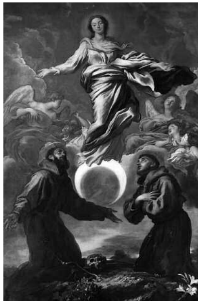
“La Inmaculada Concepción con San Francisco de Asís y San Antonio de Padua”. Giovanni Benedetto Castiglione, 1650

Decíamos que san Antonio es “mariano” porque es cristocéntrico, porque reconoce el primado de Cristo sobre todo y sobre todos de ahí que María en cuanto Madre de Dios (el Verbo hecho carne, Jesús) tiene un puesto privilegiado en su corazón y en su pensamiento. Dicho en otras palabras, la mariología es consecuencia de la cristología. El Misterio de Ma-