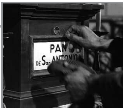
Escena del cepillo del Pan de San Antonio, donde el pobre recogía el bollo que el cura le dejaba en la película Historias de la radio , de José Luis Sáenz de Heredia.