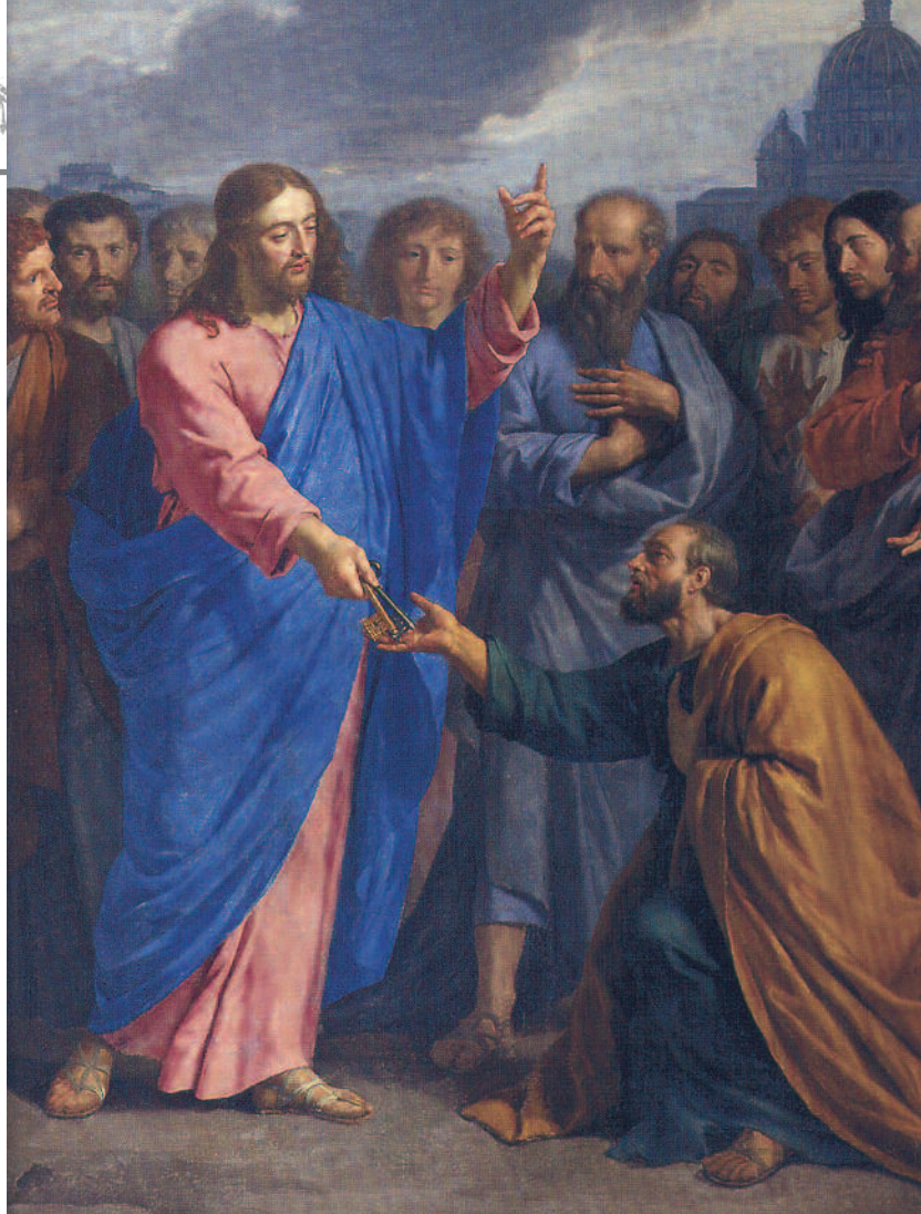
“La entrega de las llaves a San Pedro” vers 1664. Philippe de Champaigne. Catedral de Saint Gervais et Saint Protais, Soissons. (Francia)