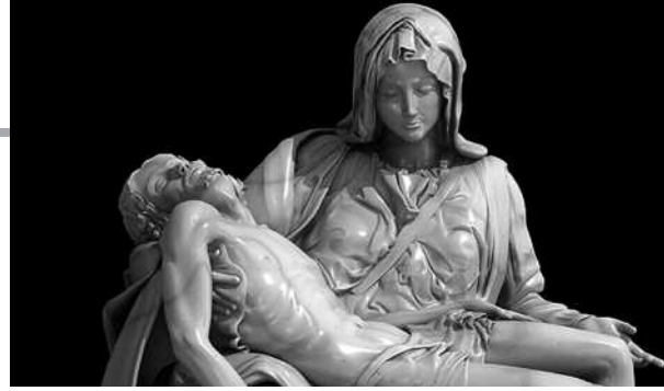
"Piedad del Vaticano". Miguel Ángel. Basílica de San Pedro, Roma

E N María resalta la posesión de todas las virtudes en el más alto grado, constituyéndose en verdadero modelo. La sede en que conserva y hace crecer todo ese magnífico conjunto es su Corazón virginal, tesoro de todas las virtudes. No podemos evitar traer la cita entera de una lista larga y completa que Pío XII ofrece con respecto a las virtudes marianas: “la delicadeza de su Corazón Inmaculado, el recogimiento y el espíritu de oración del que habla el Evangelio cuando recuerda por dos veces que Ella conservaba en su Corazón el recuerdo de las gracias de Dios y de las acciones del Niño Dios (Lc 2,19.51); el amor de Dios, que resplandece en el Magnificat; el amor de los demás; de todos los demás; de sus parientes, de sus amigos, de todos los hombres; esa caridad incomparable que la hizo volar al servicio de su prima Isabel cuando conoció su próxima maternidad; que la hizo compadecerse del apuro de los esposos cuando el vino empezó a faltar en las bodas de Caná; que la unió de forma tan dolorosa y profunda a los sufrimientos