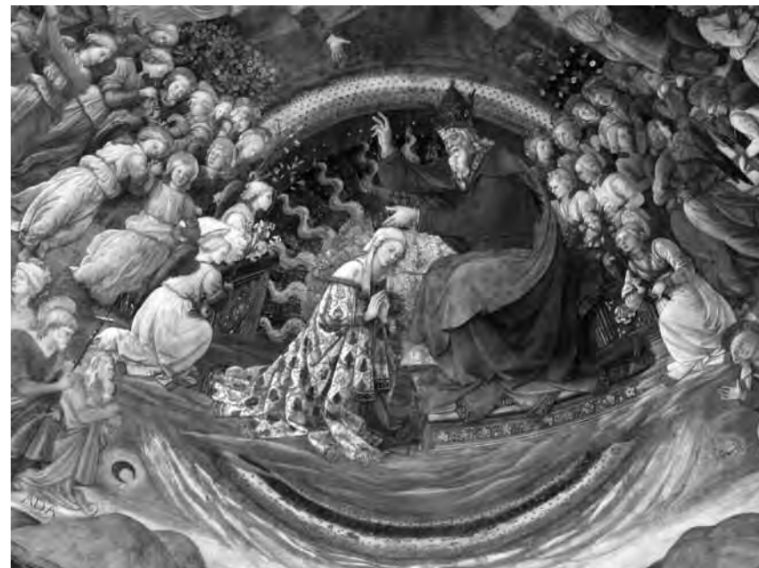
“Asunción de la Virgen” Filippo-Lippi (1457–1504). Catedral de Spoleto (Italia)

El nacimiento de Jesús sin quebrantar la Virginidad de María ha sido comparado con la luz que atraviesa un cristal sin romperlo.