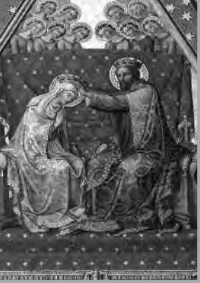
"Coronación de la Virgen" Mosaico de la Catedral de Orvieto (Italia)