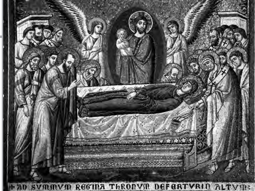
“La dormición de la Virgen” Mosaico de la Basílica de Santa María Mayor en Roma.

Cuando nos referimos al lugar en el que nació Europa y del que provienen parte de los usos, los valores y la cultura de los europeos, hablamos de Grecia e, inmediatamente, generalizamos aplicando el concepto: helenístico. Sabemos que