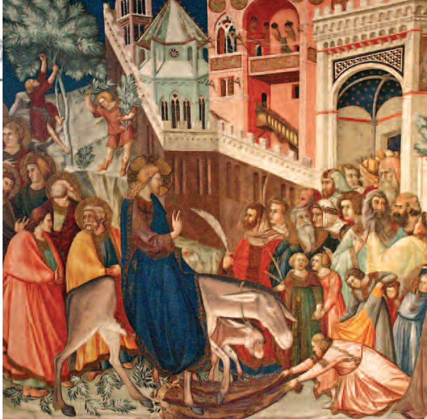
“Cristo entrando en Jerusalén” (1320-1330), fresco de Pietro Lorenzetti para la basílica inferior de San Francisco, Asís (Italia).